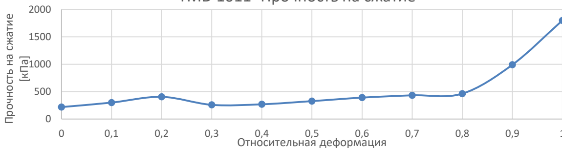
TMD 1011- Прочность на сжатие